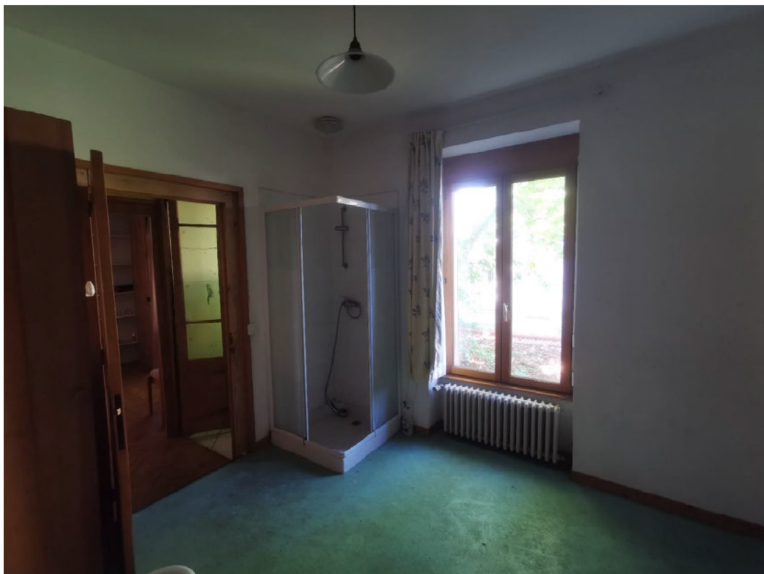
WC - R+1

Sol carrelé en état d'usage. Murs tapissés en état moyen. Un lave main en état d'usage. Double porte vitrée en état d'usage.