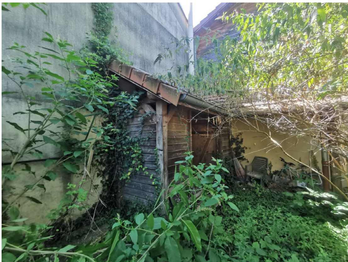
Présence d'une dalle en partie Nord.