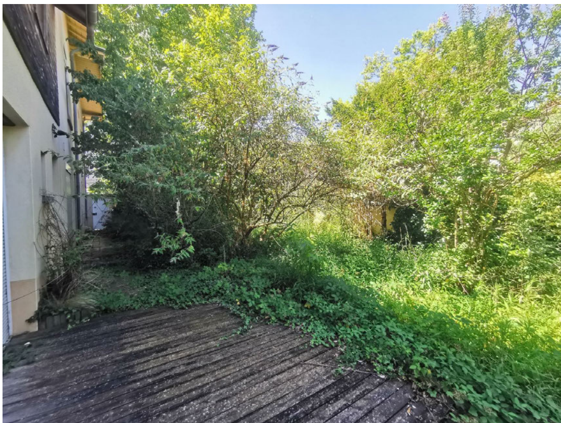
Un appentis sur la façade Nord.